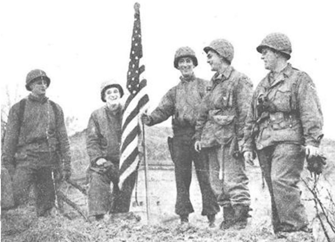
La Bannière étoilée sur la caserne du GF Jeanne d'Arc